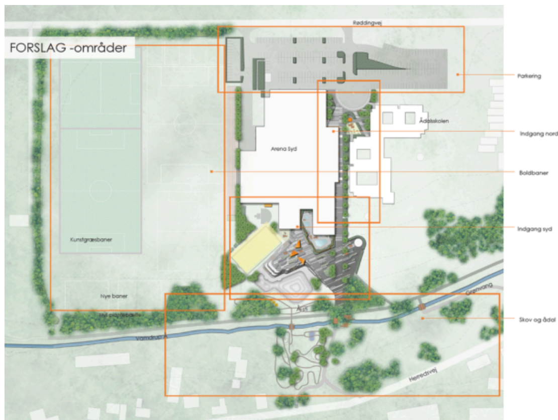
Forslag til opdeling af helhedsplanen i delområder.

Helhedsplanen har karakter af en visionsplan for Arena Syd, båret af de forskellige lokale interessenters ønsker. Der er ikke taget stilling til økonomien eller hvordan den i givet fald skal tilvejebringes, med undtagelse af det beløb på 500.000 kr., som byrådet med Budget 2019 har afsat til åsteder i Vamdrup. Den præcise placering og udformning af dette er ikke afklaret endnu. Dette beløb udmøntes i Teknik- og Klimaudvalget.