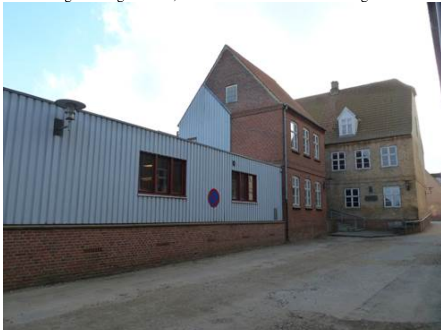
Foto af Nørregade 12 set fra nord med barakken i forgrunden.

Hovedbygningen for Nørregade 12 er sammenbygget med en barak fra 1979, der er meget skæmmende for bymiljøet. Der var i 2013 afsat midler til en nedrivning, hvilket også er blevet oplyst til borgermøder i byen. Det har dog ikke været muligt at prioritere/disponere midler til nedrivning af barakbygningen i 2013, da Byrådet i forbindelse med vedtagelsen af budget 2013 besluttede at reducere midlerne til bygningsvedligeholdelse med 5 mio. kr. Inden salg af Nørregade 12 vil det være hensigtsmæssigt at sikre, at barakken fra 1979 nedrives og facaden mod nord reetableres.