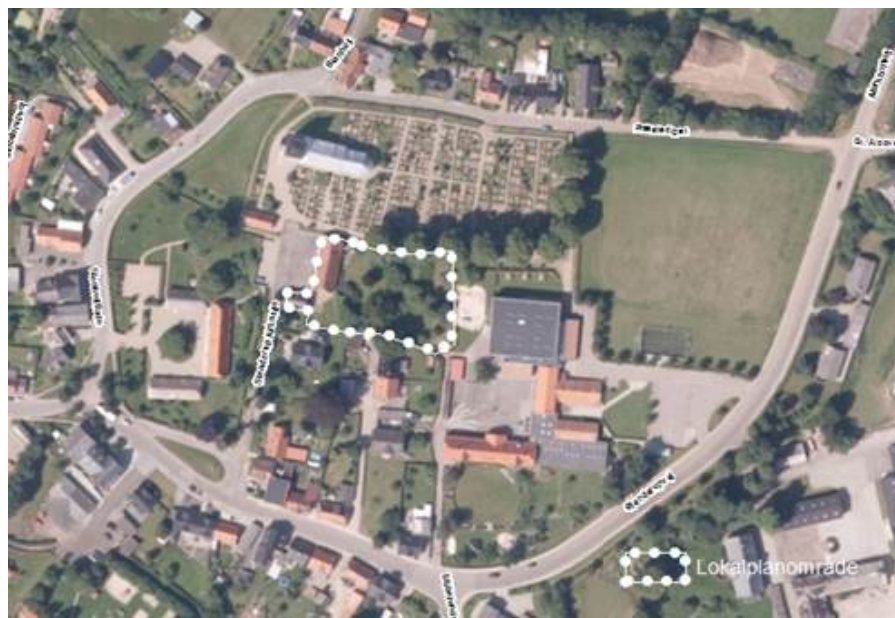
Lokalplanområdets placering i Sdr. Stenderup

Lokalplanen er kategoriseret som en A-lokalplan, jævnfør A, B, C-kategoriseringen, hvilket betyder, at det er Byrådet, der træffer beslutning om planforslagets udsendelse i offentlig høring.