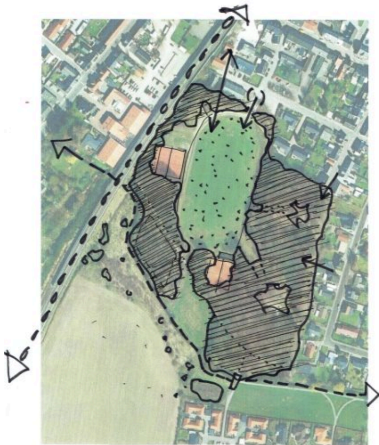
Kort over Margrethelunds integration i Det Grønne Strøg – skitse som en del af helhedsbetragtningerne.