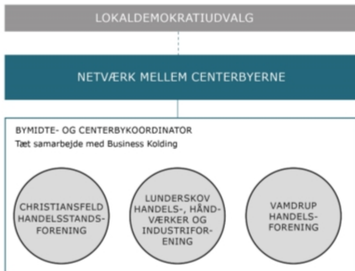
Illustration af forankringen af Task Force indsatsen i centerbyerne.

Styregruppen for Task Forcen anbefaler derfor, at den videre forankring af indsatsen forankres under bymidte – og centerbykoordinatoren i tæt samarbejde med Business Kolding. Centerbyerne mødes 1-2 gange årligt i en netværksgruppe, hvor idéer og mulige synergier deles. Denne indsats forankres under Lokaldemokratiudvalget.