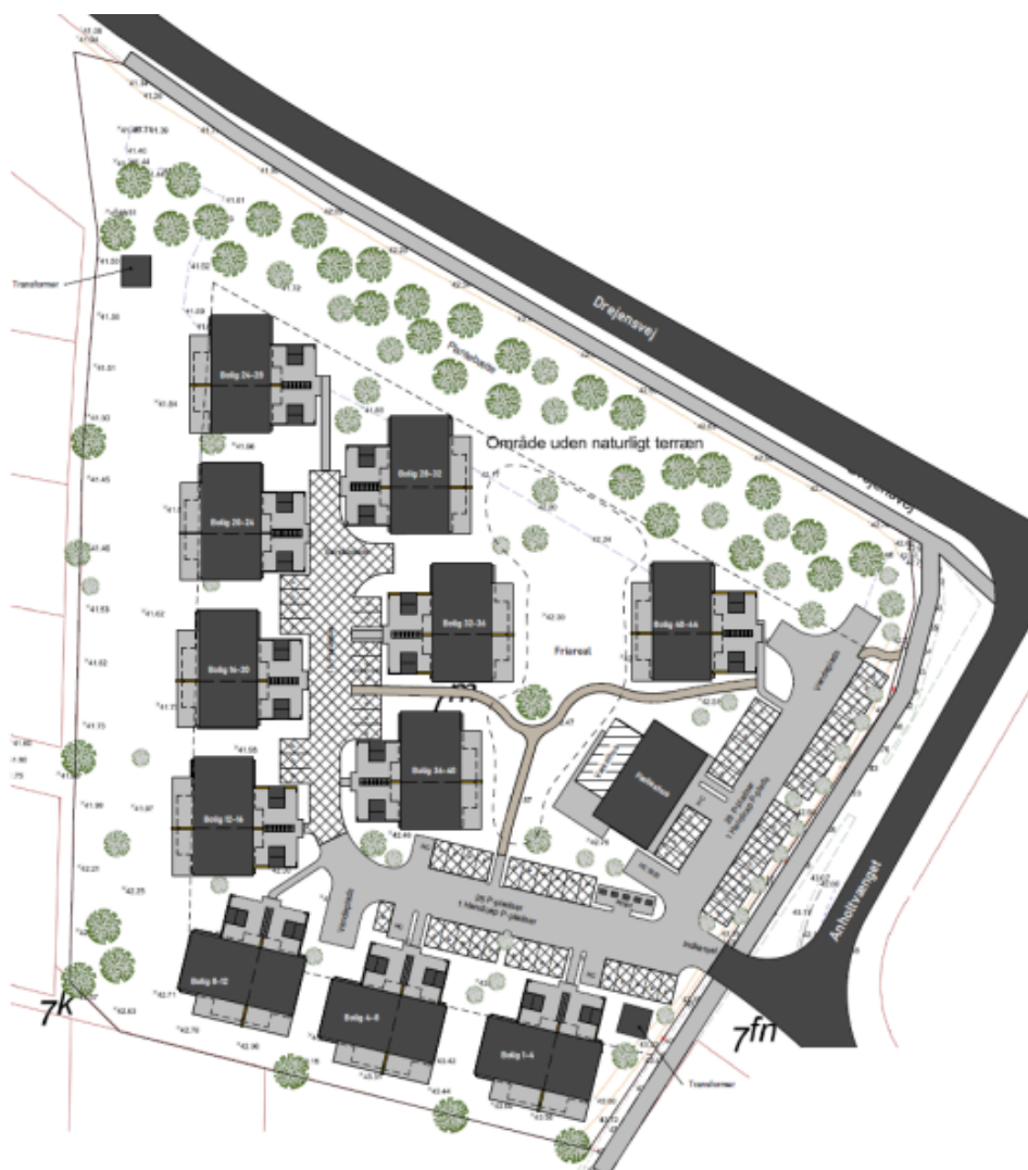
Lokalplanforslagets illustrationsplan, der viser planområdets mulige bebyggelse

Den del af det første delområde, der omfatter areal til Drejensvej, bliver beplantet og arealet mod vest mod boligområdet bliver ubebygget med mulighed for nedsivningsområde for regnvand. Delområdet omtrentligt i midten af planområdet bliver til bebyggelse og anlæg.