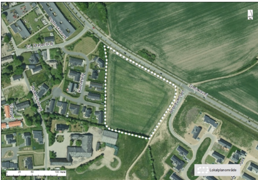
Luftfoto med planområdets afgrænsning og beliggenhed til Drejensvej, Anholtvænget og det eksisterende enfamiliehusområde ved Kastaniely mod vest.