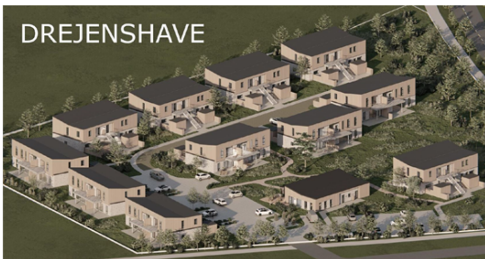
Planområdets ejer udvikler området under navnet 'Drejenshave'

Lokalplanen understøtter arkitekturstrategien ved at have fokus på at skabe en bebyggelse med en arkitektonisk identitet, der understøtter bydelens fortælling.