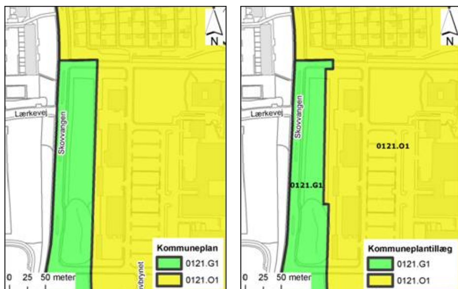
Afgrænsning af enkeltområderne 0121 G1 og 0121 O1

Kommuneplantillægget ændrer afgrænsningen mellem rammeområde 0121 G1 og 0121 O1, således en mindre del af 0121 G1 ændres til 0121 O1.