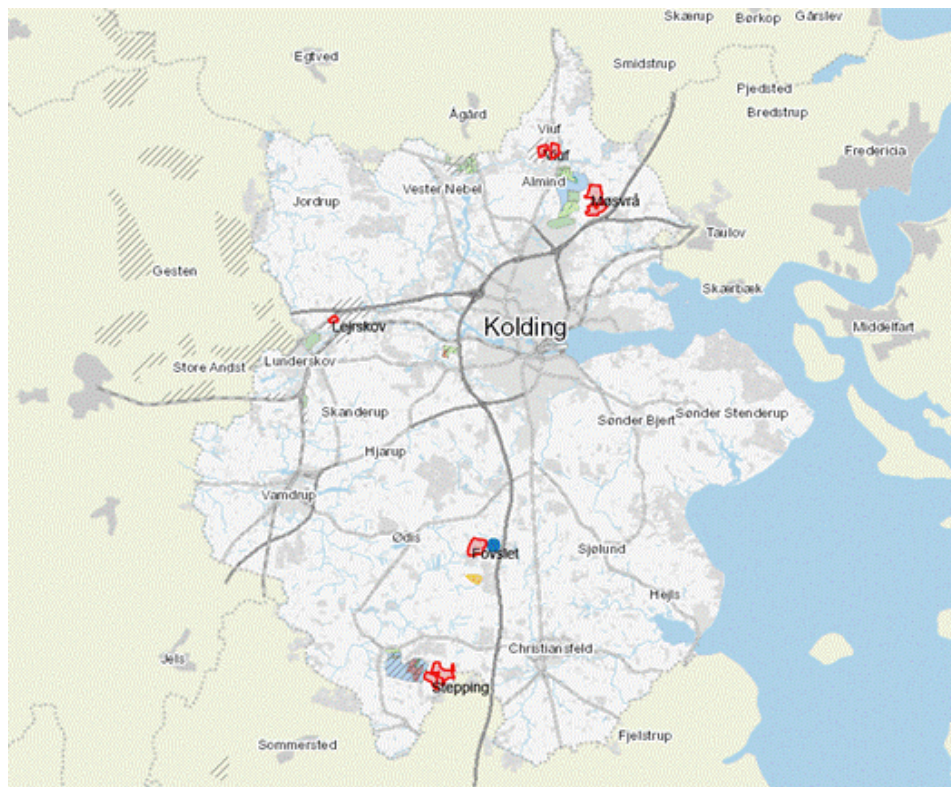
Fig. - Eksisterende og foreslåede nye råstofvindingsområder.

Forslag til nye områder er indtegnet med rød markering. De eksisterende graveområder er indtegnet med skravering med farve og interesseområderne er indtegnet med skravering uden farve.