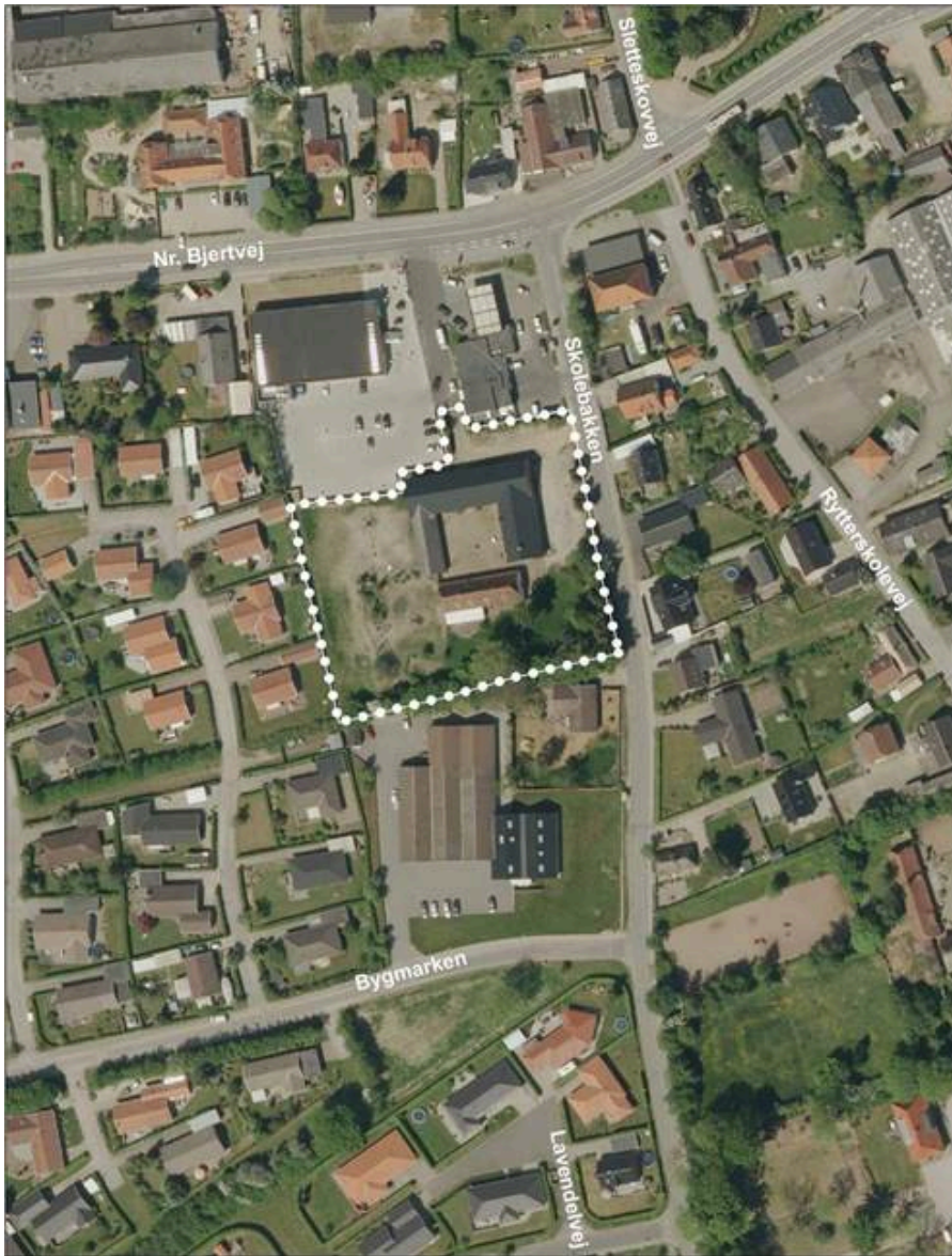
Kortbilag med afgrænsningen af kommuneplantillæg 10 og lokalplan 0531-16.