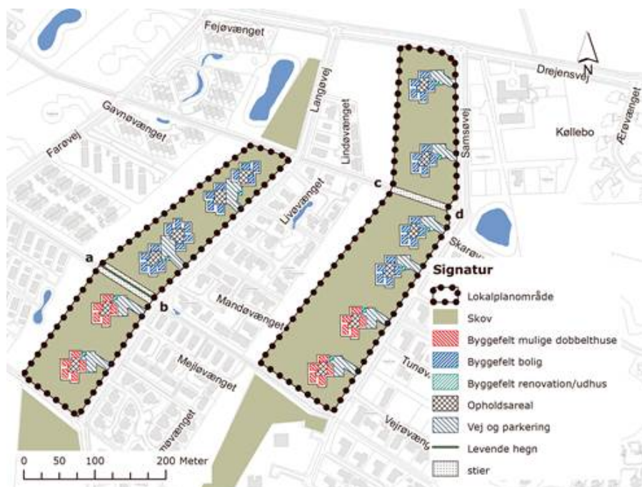
Plan for området jf. gældende lokalplan 0522-12.

første lokalplan, blev der i 2010 vedtaget en ny lokalplan for disse skovparceller, lokalplan 0522-12. Lokalplan 0522-12 udlægger skovparcellerne til skov med større lysninger til enfamilieshuse eller dobbelthuse i to etager på sokkelgrunde.