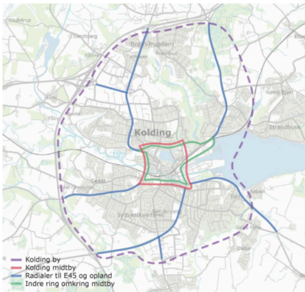
Afgrænsning af trafikplanen.

Trafik- og mobilitetsplanen vil indeholde en fremtidig plan for vej- og stinettet samt vise en plan for parkeringen i byen fremover, som understøtter kommunens mål.