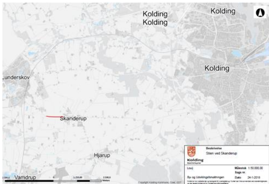
Stiens placering i forhold til Kolding