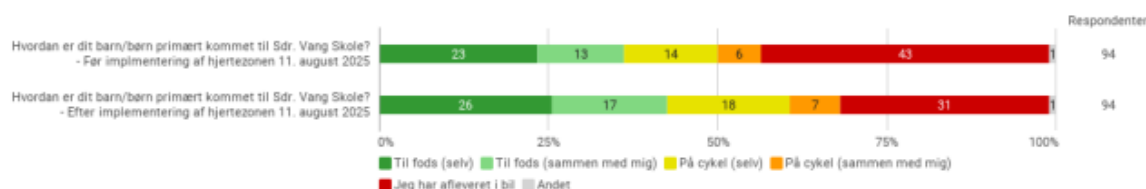
Figur 7: Forældres besvarelse af, hvordan deres barn/børn er kommet til Sdr. Vang Skole før og efter etablering af hjertezoneen

I spørgeskemaet har der været spørgsmål kun rettet til forældre med børn på skolen. De er blevet spurgt til, hvordan deres barn/børn er kommet til skole henholdsvis før og efter etablering af hjertezoneen. Der er sket en stigning i elever, som går eller cykler til skole. Den største procentvise stigning er sket blandt elever, som cykler selv, hvor andelen er steget fra 14 % til 18 %. Andelen af elever, som bliver afleveret i bil, er faldet fra 43 % til 31 %.