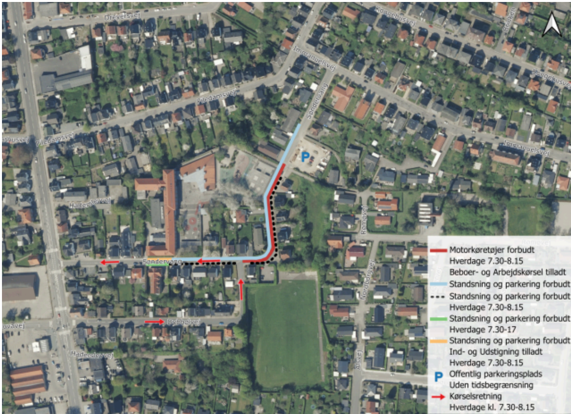
Figur 2: De trafikale ændringer, som har været gældende siden den 11. august 2025