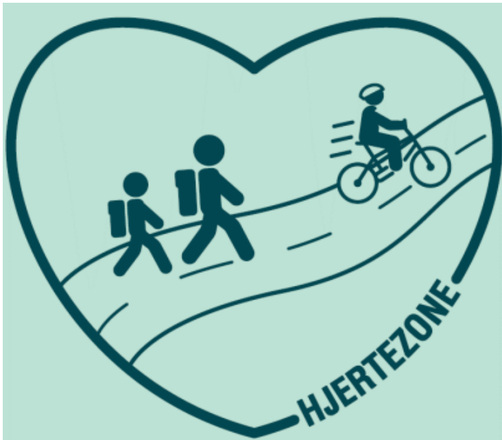
Figur 4: Logo til den lokale kampagne

Hjertezonen har været testet i skoleåret 2025/2026 og afslutter i juni 2026.