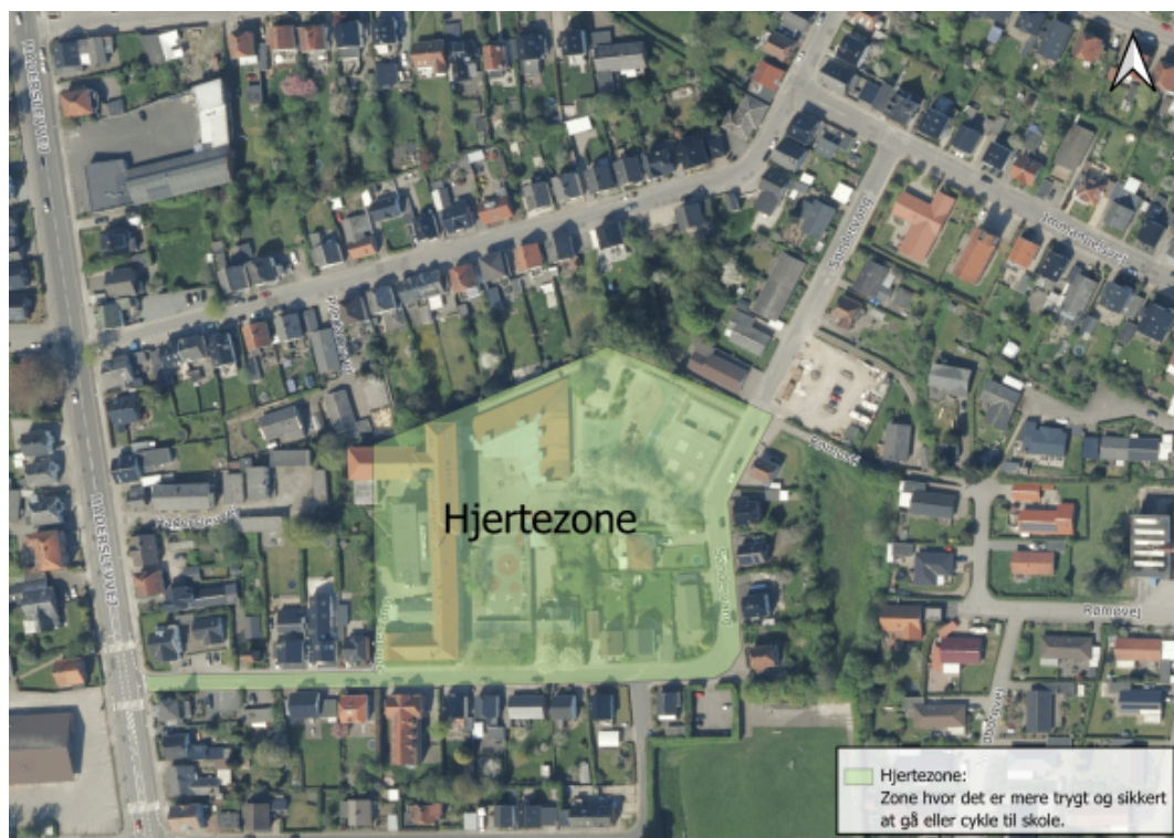
Figur 1: Grøn markering - Hjerterzonen omkring Sdr. Vang Skole, hvor formålet var at gøre det tryggere for elever, der går eller cykler til skole

En hjerterzone er en zone, hvor biltrafikken begrænses for at gøre ruten for gående og cyklende tryggere. Hjerterzonen ved Sdr. Vang Skole er vist på nedenstående billede.