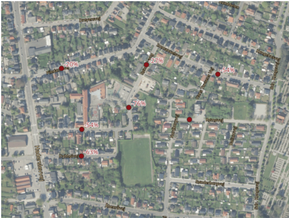
Figur 5: Ændring i biltrafikken som følge af etablering af en hjertezone.