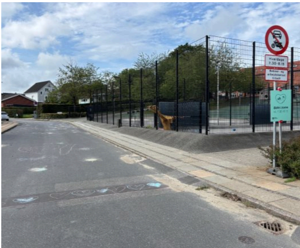
Figur 3: Lokal kampagne "Bilfri zone" til at supplere budskabet om, at vejen er til for gående og cyklende kl. 7.30-8.30