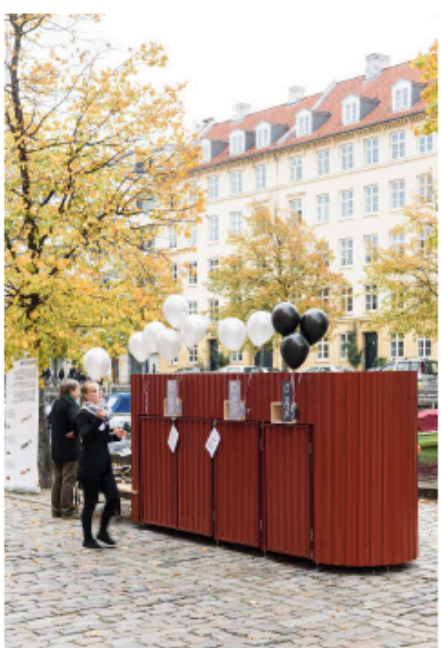
Eksempel på beholderløsning i København

Fordelene ved de overjordiske løsninger er: