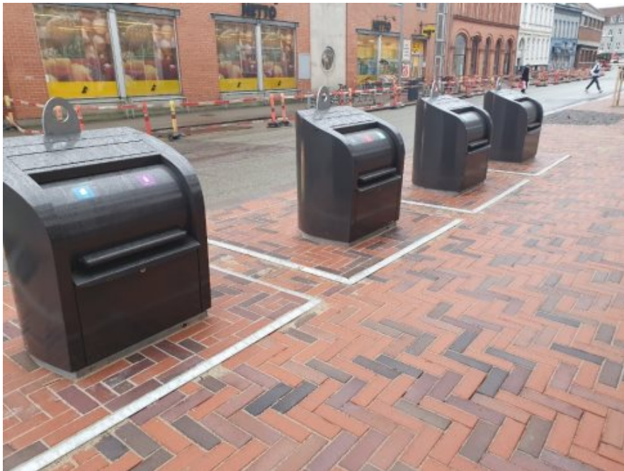
Nedgravet løsning i Jernbanegade 35