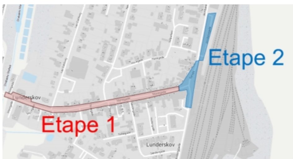
Etape 2 vil indbefatte Torvet og bus- og parkeringsplads

Det foreslås derfor, at der afsættes 2,0 mio. kr. til realisering af dele af forskønnelse af Storegade i Lunderskov, etape 2, Torvet, og at der udarbejdes en samarbejdsaftale med DSB Ejendomme om planlægning og udførelse af hele etape 2, samt at der fremsættes et udvidelsesforslag til budget 2021 til brug for færdiggørelse af bus- og parkeringsplads i samarbejde med DSB, således at der sikres helhed i det samlede projekt.