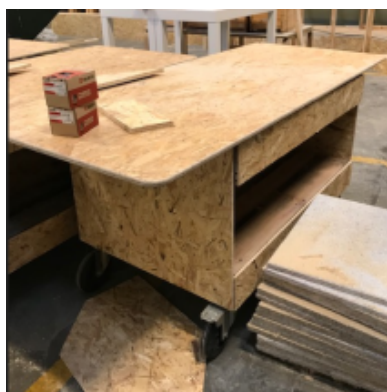
Foto: Et mobilt værkstedsbord under udarbejdelse i hallen.

Selve driften medfinansieres med ca. 200 arbejdstimer af de i forvejen afsatte midler i strategien.