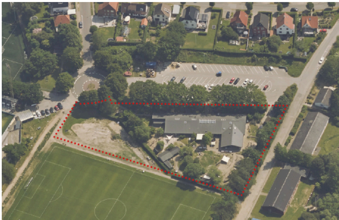
Skråfoto af planområdet set fra vest – lokalplanområdet markeret med røde prikker

Institutionens karakteristiske indramning af træer og anden beplantning skabt med den eksisterende lokalplan er videreført og sikret med særskilte bestemmelser i lokalplanforslaget.