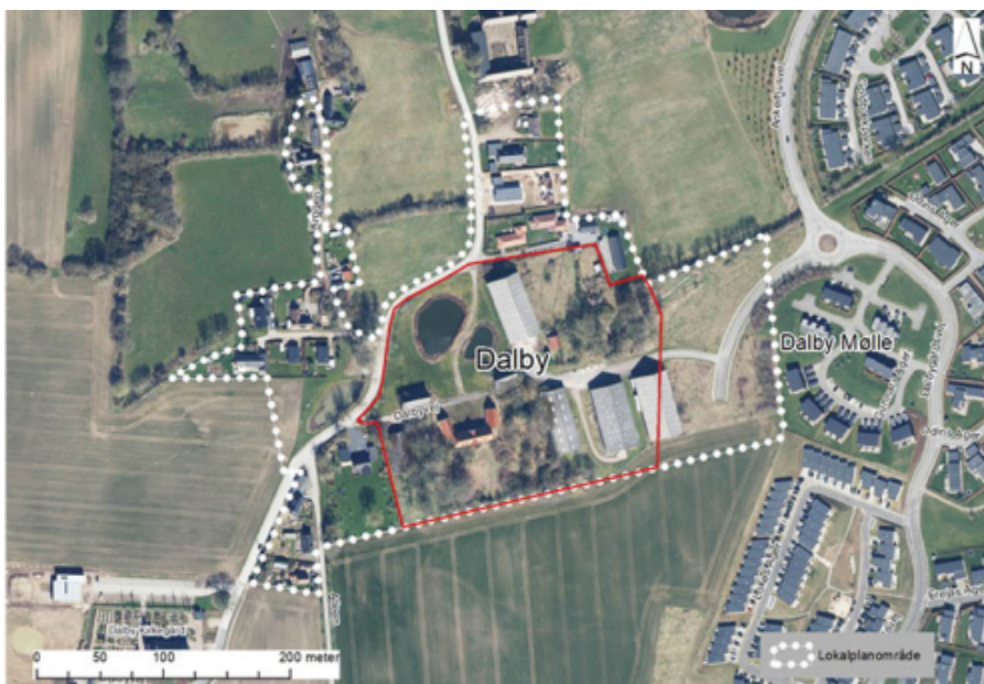
Lokalplanområdet omfatter hovedparten af landsbyen Dalby. Delområdet, hvor lokalplanen særligt muliggør nyt byggeri, er markeret med rød ramme. Kolding Kommune ejer i dag de tre større haller nederst til højre i den røde ramme.