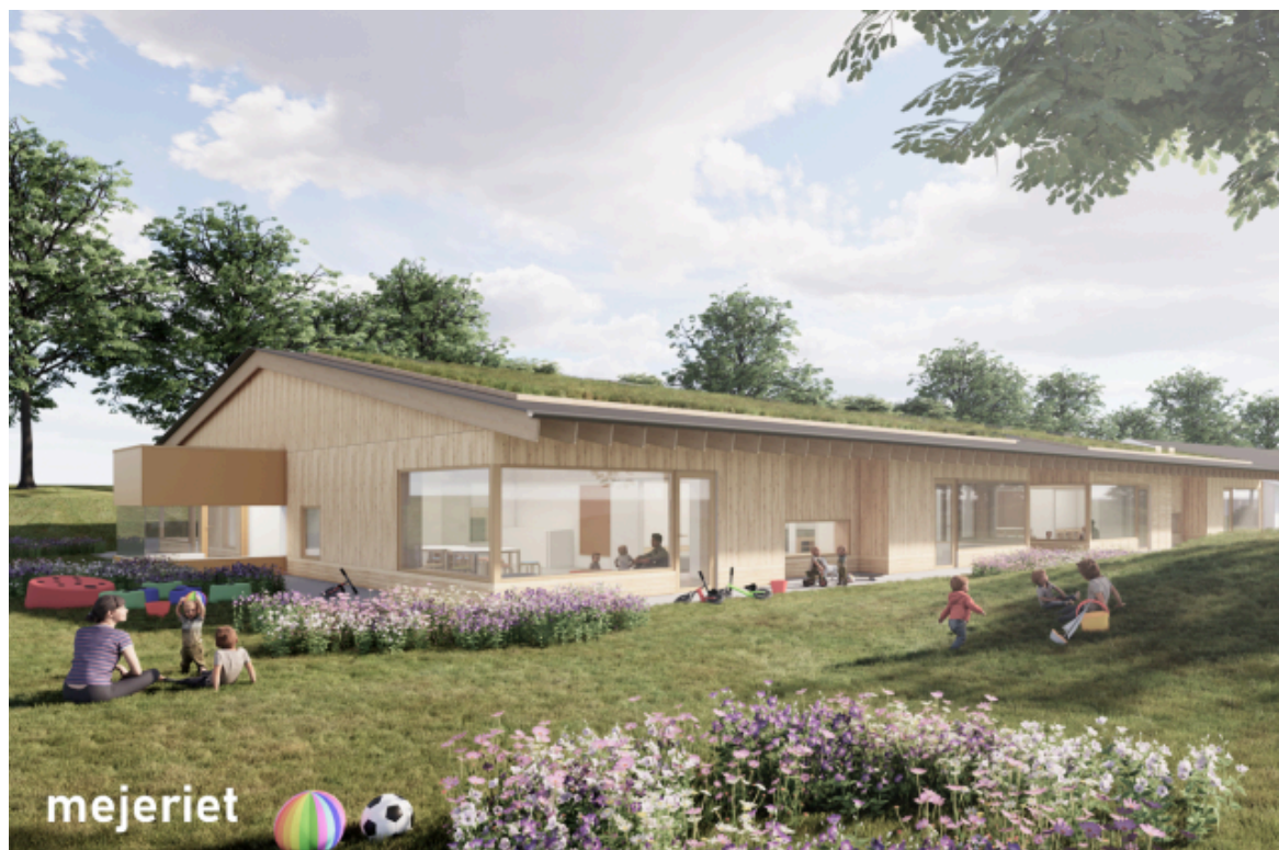
Visualisering af den påtænkte udbygning af institutionen. Bygningen er set fra nordvest.

Lokalplanens bestemmelser om bebyggelse er formuleret, så de muliggør en hensigtsmæssig udvidelse af de eksisterende institutionsbygninger og et samlet byggeri i tråd med Kommunens ambitioner for bæredygtigt byggeri.