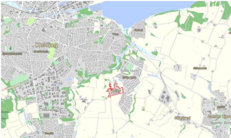
Landsbyen Dalby er beliggende ved Koldings sydlige udkant.