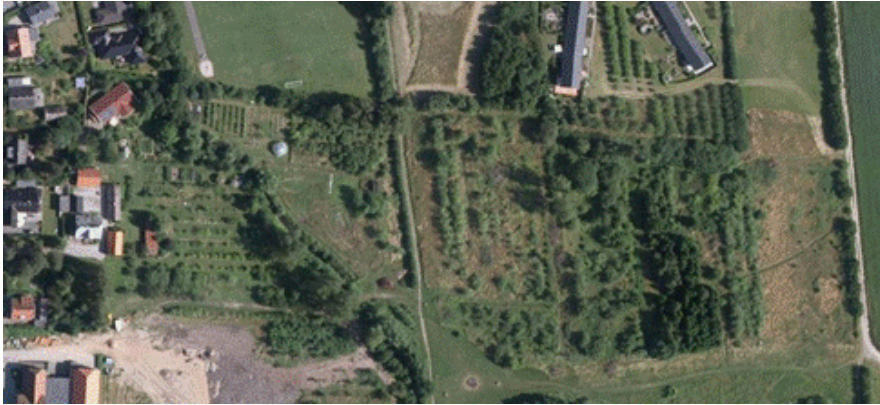
Jordrup (6) Byparken ved Bytoften