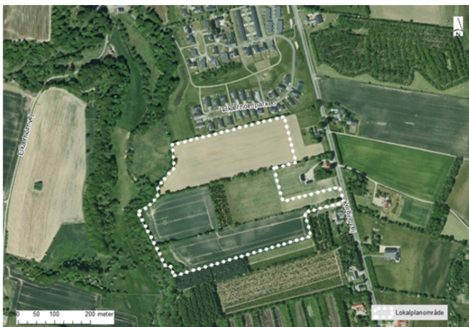
Luftfoto, som viser lokalplanområdets afgrænsning