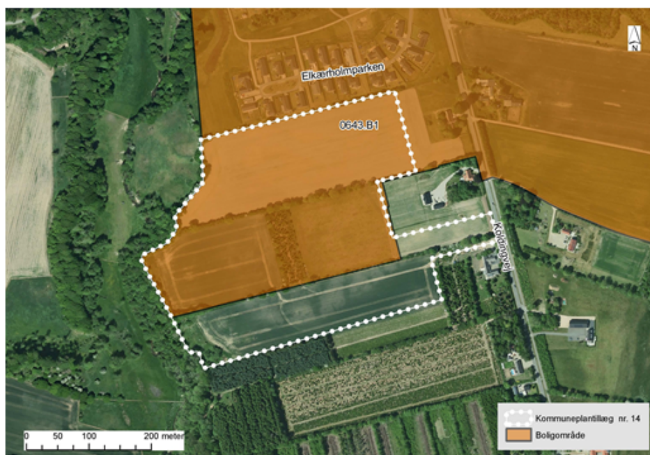
Luftfoto med rammekort før Kommuneplantillæg 14

For en mere uddybende gennemgang af kommuneplantillæggets indhold henvises til redegørelsen i vedlagt Forslag til Kommuneplantillæg 14.