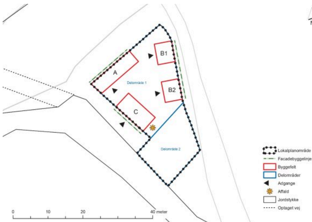
Kort, der viser disponeringen af lokalplanområdet

Delområde 2 udlægges til udendørs opholdsarealer, hvor der kan opstilles gynger, legeredskaber, bænke og lignende, som understøtter anvendelsen til leg og ophold.