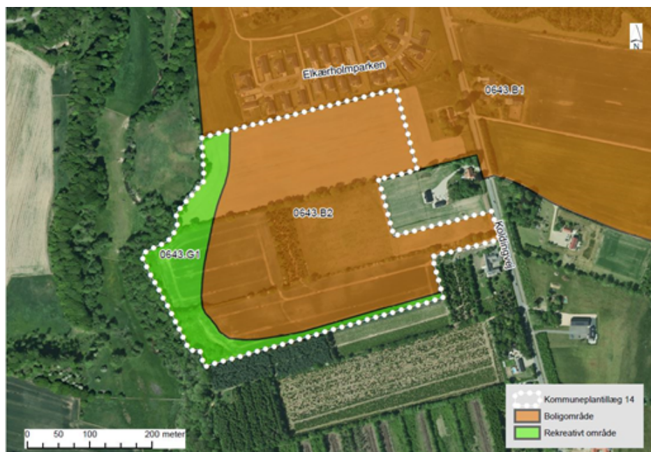
Luftfoto med rammekort efter Kommuneplantillæg 14