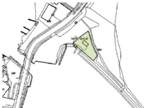
Lejet areal ved lystbådehavnen