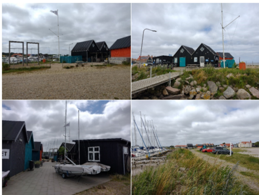
Billeder af forholdene i dag, der viser udbygningen med skure og båduse, som er midlertidigt opført på baggrund af en rammesat prøvehandling

Forvaltningen har hørt foreningerne Hejlsminde Bro- og Bådelaug og Hejlsminde Strandpark i forbindelse med udarbejdelsen af lokalplanforslaget. De havde ingen yderligere ønsker i forhold til det allerede etablerede.